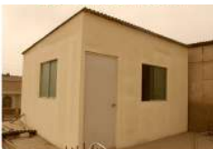
STAR TÉC. ENFERMERÍA