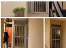
U. ECONOMÍA Y PROF. NO MÉDICOS