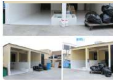
ALMACENAMIENTO DE RR.SS.