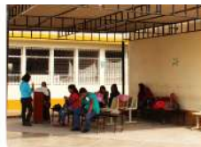
STAR PARA USUARIOS