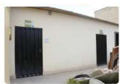
MORTUORIO Y NUEVO ALMACEN COE